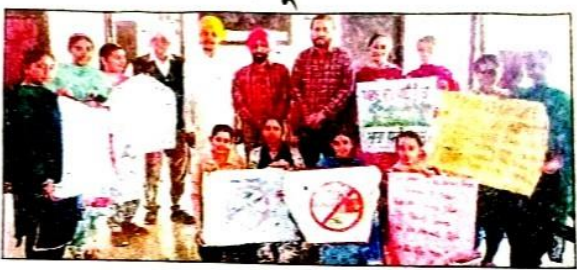
ਦੇਸ਼ ਭਗਤ ਕਾਲਜ ਵਿਖੇ ਕਰਵਾਏ ਪ੍ਰੋਗਰਾਮ ਦਾ ਦ੍ਰਿਸ਼।

ਤਹਿਤ ਅੱਜ ਇਨ੍ਹਾਂ ਨੇ ਪਹਿਲਾ ਪ੍ਰੋਗਰਾਮ ਉਲੀਕਿਆ ਹੈ, ਜਿਸ ਨਾਲ ਵਿਦਿਆਰਥੀਆਂ ਨੂੰ ਵਾਤਾਵਰਣ ਸਬੰਧੀ ਦਿੱਤੀ ਗਈ।