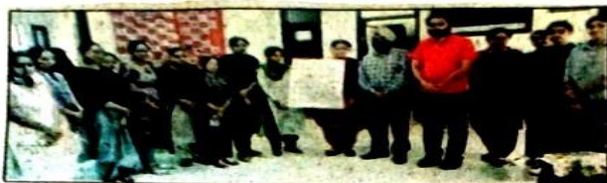
ਦੇਸ਼ ਭਗਤ ਕਾਲਜ ਬਰੜ੍ਹਵਾਲ ਵਿਖੇ ਸਮੌਰ ਕਰੈਸ਼ ਕੋਰਸ ਇੰਨ ਇੰਗਲਿਸ਼ ਸਟੱਡੀਜ਼ ਦੀ ਸ਼ੁਰੂਆਤ ਮੌਕੇ ਦਾ ਦਿਸ਼।